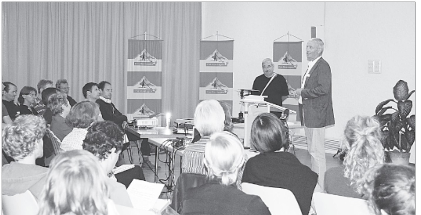
Das alle zwei Jahre durchgeführte Gebirgsforschungs-Meeting findet diese Woche im Briger Pfarreizentrum statt.

len monatlich einen bestimmten Betrag (z. B. in Prozent ihres Lohnes) in einen «Förderpool für Bergregionen» ein. Wenn zum Beispiel 600 Personen monatlich 100 Franken bezahlen, ergibt das einen jährlichen Beitrag für den Förderpool von immerhin 720 000 Franken. Für die Ausschüttung dieser Gelder bilden die Zahlenden aus ihrer Mitte ein entsprechendes Gremium, welches verschiedene Projekte sammelt und nach klar festgelegten Kriterien die vorhandenen Mittel auszahlt. Dies ist sicher ein eher kleiner Tropfen auf einen heissen Stein, aber all jene, die sich von Berufes wegen mit Bergregionen beschäftigen, würden mit ihrem monatlichen finanziellen Engagement ihre Solidarität bekunden und so einen aktiven Beitrag für die von ihnen zum Teil selber angeregte Entwicklung leisten.